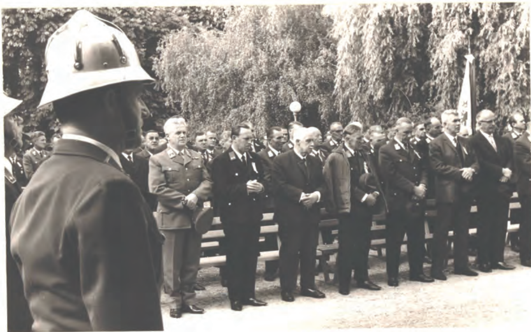
Festgottesdienst im Kernpark