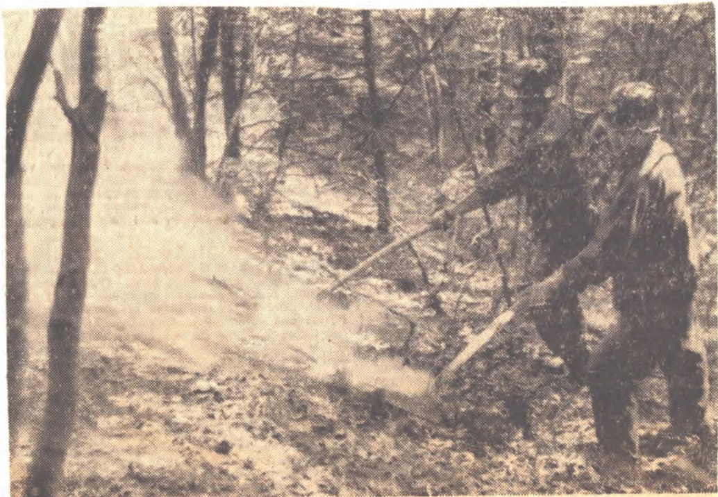
Bis zu einem Meter tief brannte der Humus beim Waldbrand, der, wie ausführlich berichtet, am Mittwoch im Gebiet des Rauschbrunnens oberhalb des Innsbrucker Stadtteils Hötting ausgebrochen war und von dem man vermutet, daß er gelegt worden ist.