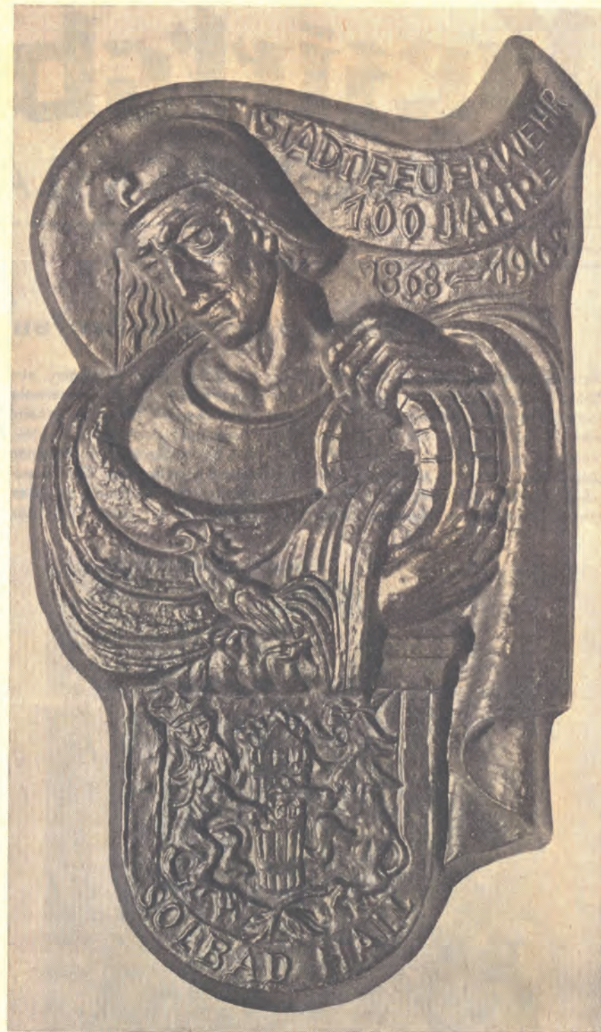
Die von Karl Obleitner, Absam, geschaffene Reliefplastik

Im Jahre 1967 waren im Bezirk 207 Brände, die einen Schaden von 6,6 Millionen Schilling verursachten, zu verzeichnen. In sieben Fällen mußte die Feuerwehr zur Bekämpfung ausrücken. Der Brandstatistik ist zu entnehmen, daß Elektrizität als Brandursache mit 31,3 Prozent noch immer an der Spitze steht. Es folgen sonstige Licht- und Wärmequellen (22,2 Prozent), bauliche Mängel (11,1 Prozent), Maschinen und Blitzschläge (je 8,7 Prozent), feuergefährliche Stoffe mit