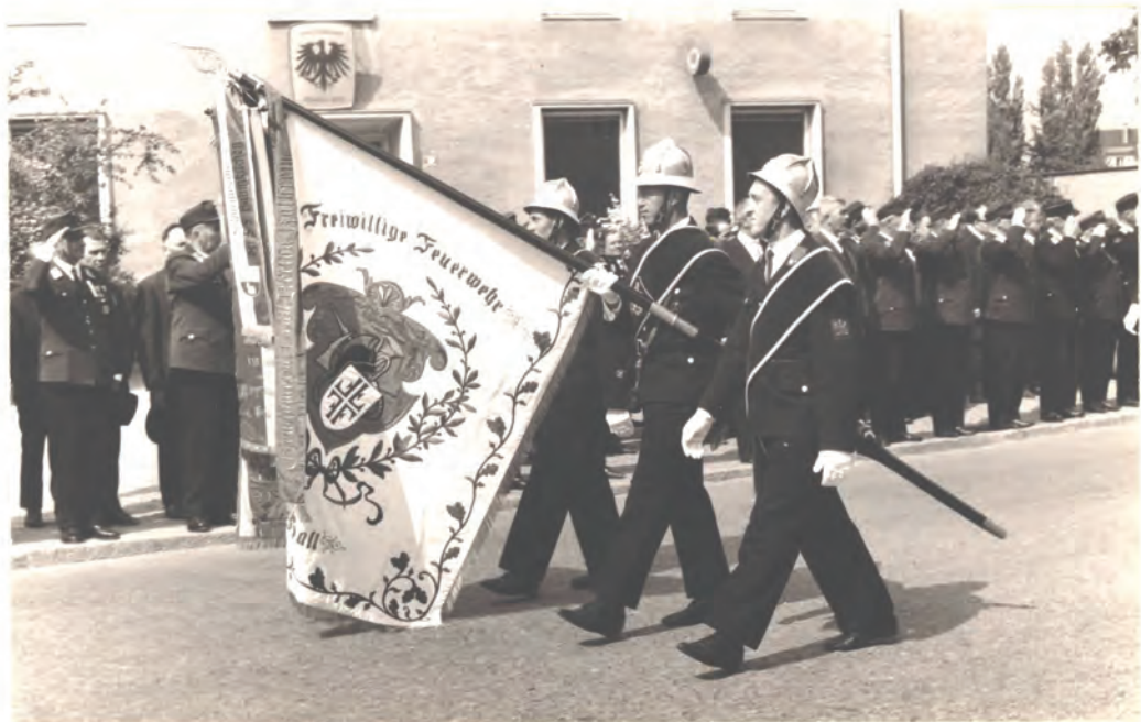
Vorbüßmarsch beim Amtsgebäude