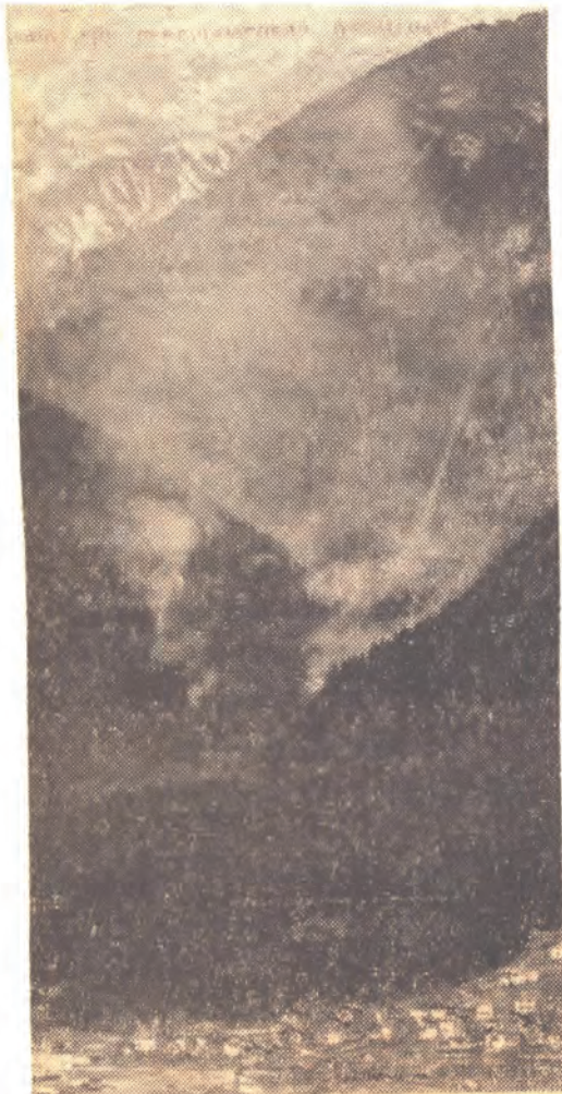
Der Waldbrand im Gebiet des Rauschbrunnens (Muraue)