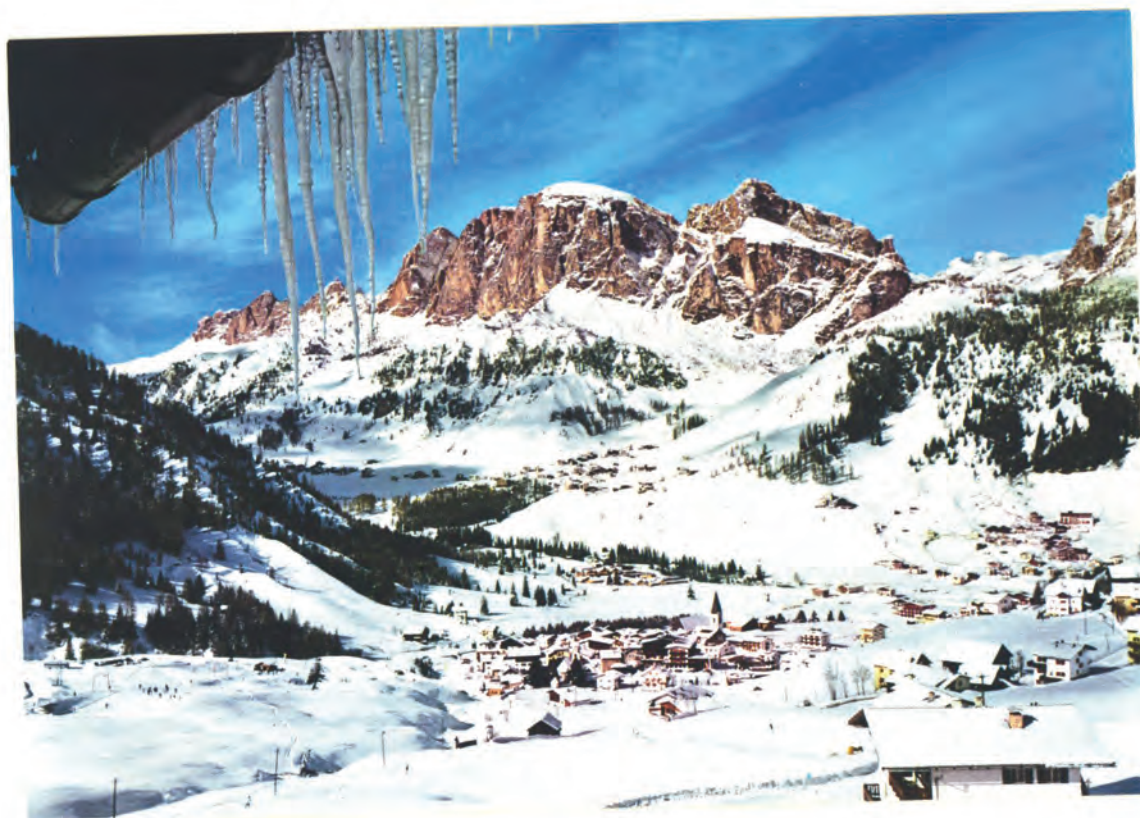
Schiausflug nach "CORVARA"