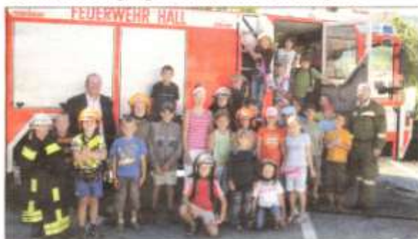
ABSCHLIEßENDES GRUPPENFOTO vor dem Stolz der Haller Stadtfeuerwehr.

Besonderes Highlight beim Haller Ferienexpress