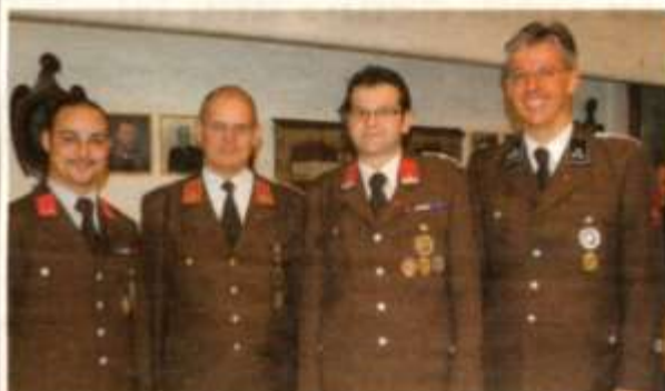
Der neue Vorstand der Stadtfeuerwehr Hall.