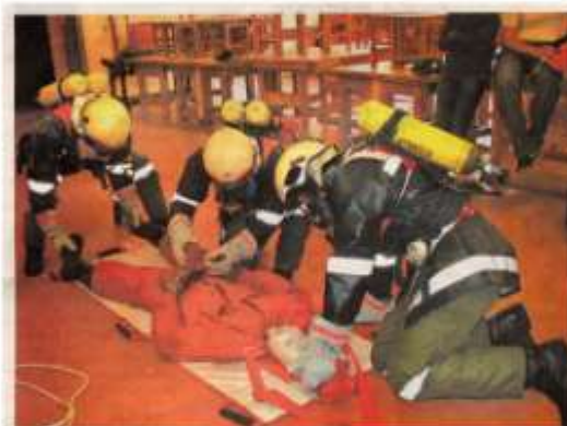
Auch wenn es nur eine Puppe war - sohöchsten Arbeit war bei der Menschenrettung gefragt.