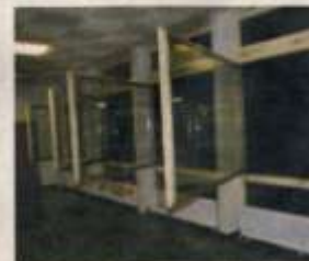
Das ganze Schulhaus wurde durchgelüftet.