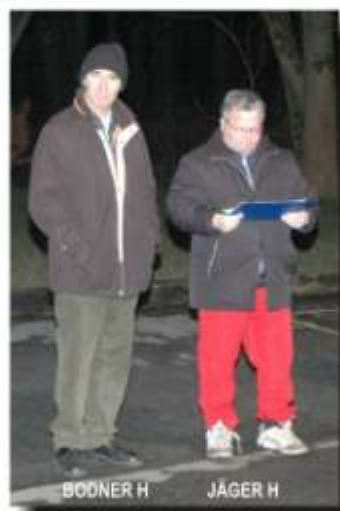
BODNER H JÄGER H