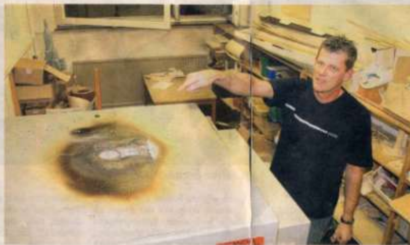
Diese Spanplatten fingen Feuer, als sie auf dem Brennofen für Tongefäße lagen, der Schulfart weiß nicht, wor sie dahin gelegt hat.

HALL (sf). Feueralarm in der Hauptschule Schöneck in hall! Vergangenen Montag machte sich am Nachmittag ein unangenehmer Geruch in der Schule be-