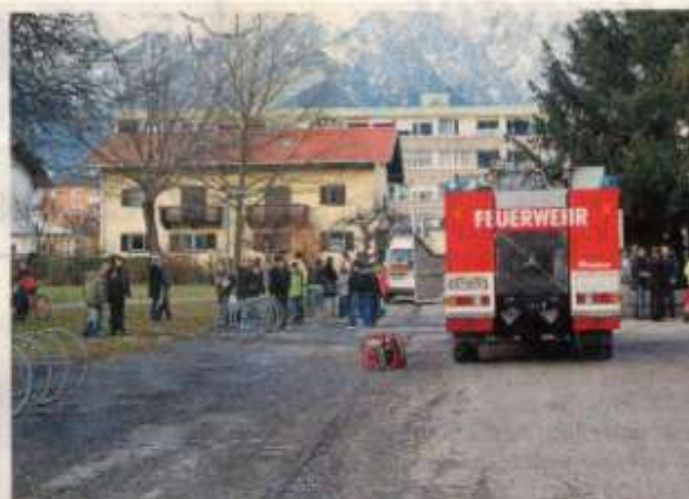
Die Kinder warten darauf, wieder in die Schule zu kommen.

„Gefährlich war es für die Schüler nicht. Der Raum war nur sehr verrauch“, sagt Strickner. In kurzer Zeit war die Lage unter Kontrolle und die Schüler konnten zurück in die Klassen. (mak)