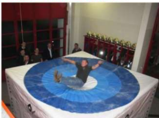
Als neuer olympischer Bewerb wird zurzeit das Riesendart mit besonderen Darts angedacht