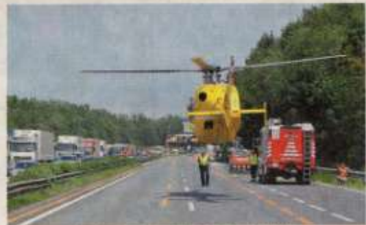
Der Notarzt-Hubschrauber flog zwei Verletzte in die Klinik.