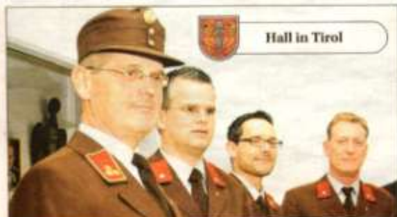
Hall in Tirol