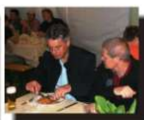
Die Stadtfeuerwehr Hall bedankt sich bei den Kameraden der Freiwilligen Feuerwehr Wattens für Ihren Einsatz