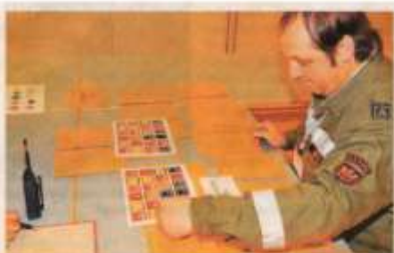
Auch das Erkennen der Dienstgrade war eine Aufgabe.

Teils – Für jedes Feuerwehrmitglied in Tirol ist es die Krönung – das Feuerwehrleistungsabzeichen (FLA) in Gold. Vergangenes Wochenende stellten sich 104 Bewerber in der Landesfeuerwehrschule in Teils den Prüfern. 61 von ihnen konnten die Feuerwehrmatura mit Erfolg abschließen. 29 Angetretene