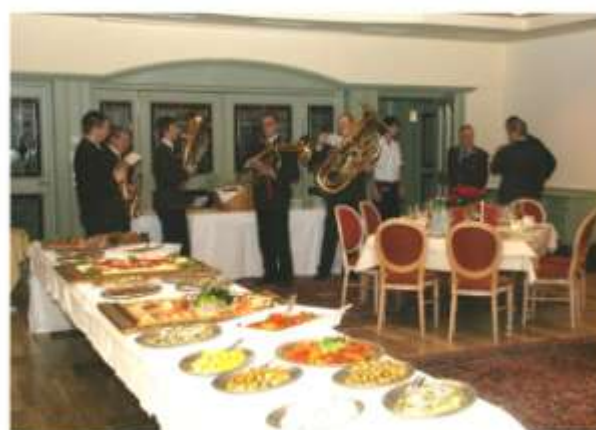
Die Absamer Musik mit dem Vorspeisenbuffet im Vordergrund