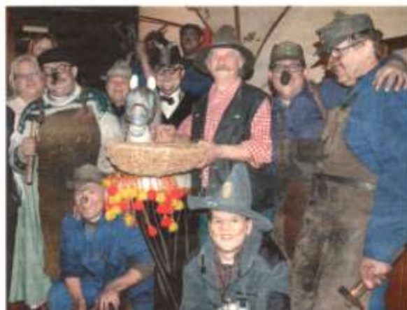
Eine schnelle Truppe: Wo das Fasserrössl mit seinen Begleitern auftaucht, geht es richtig los!

Das Rössl, Fütterer und Schenke und natürlich die charismatische „weibliche“ Begleitung des Faschings wurden von dem Gästern mit viel Applaus bedacht.