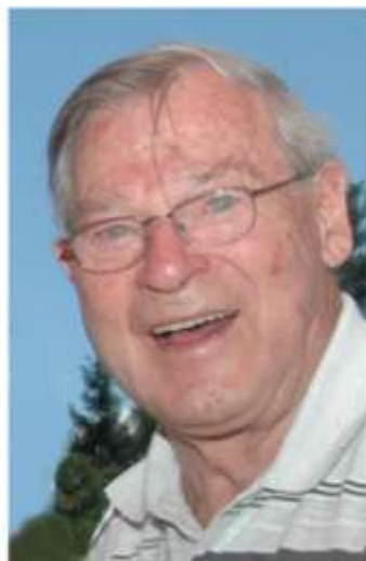
beim Familienausflug 2006