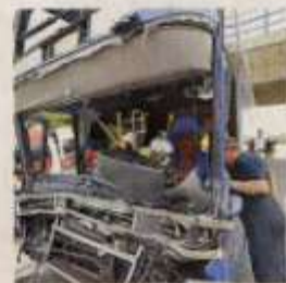
Der Vorderteil des Busses ist nur noch Schrott.

wurden mit dem Notarzt-Hubschrauber in die Klinik Innsbruck geflogen. „Wir wollten die Passagiere ursprünglich in die Feuerwache bringen. Mit Hilfe einer Dolmetscherin des französischen Kulturinstituts haben wir dann herausgefunden, dass sie in einem Hotel in Götzis wohnen, wohin sie dann auch gebracht wurden“, schildert Reichel. Die Autobahn war zwei Stunden gesperrt. (mak)