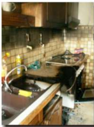
Im Einsatz standen: KDO, TLF 2000, TLF 4000, DLK 30 und WLF mit 22 Mann und 5 Mann in Bereitschaft Rettung Hall mit Notarzt Polizei Hall Stadtpolizei Hall