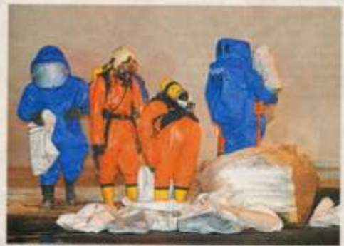
Die Mitglieder der Haller Feuerwehr sicherten die gefährliche Ladung aus dem umgestürzten Container.